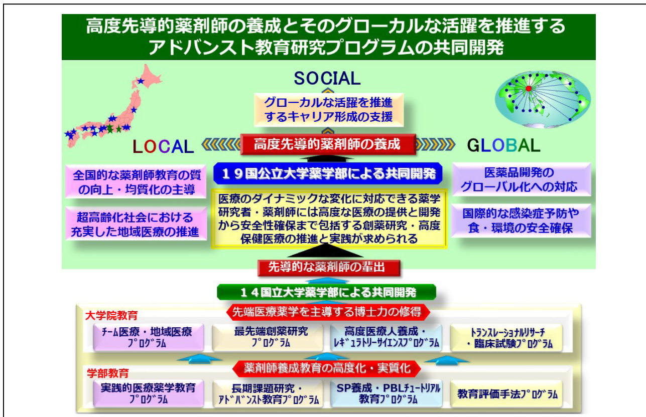
図2. 「高度先導的薬剤師の養成とそのグローバルな活躍を推進するアドバンスト教育研究プログラムの共同開発」事業の概要