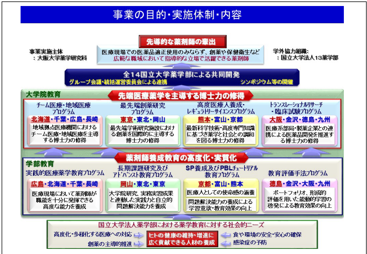
図 1. 「先導的薬剤師養成に向けた実践的アドバンスト教育プログラムの共同開発」事業

(2) 第3期中期目標期間における「高度先導的薬剤師の養成とそのグローバルな活躍を推進するアドバンスト教育研究プログラムの共同開発」事業の実施