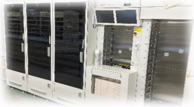
PTP全自動薬剤払出機