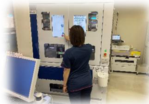
全自動散薬分包機